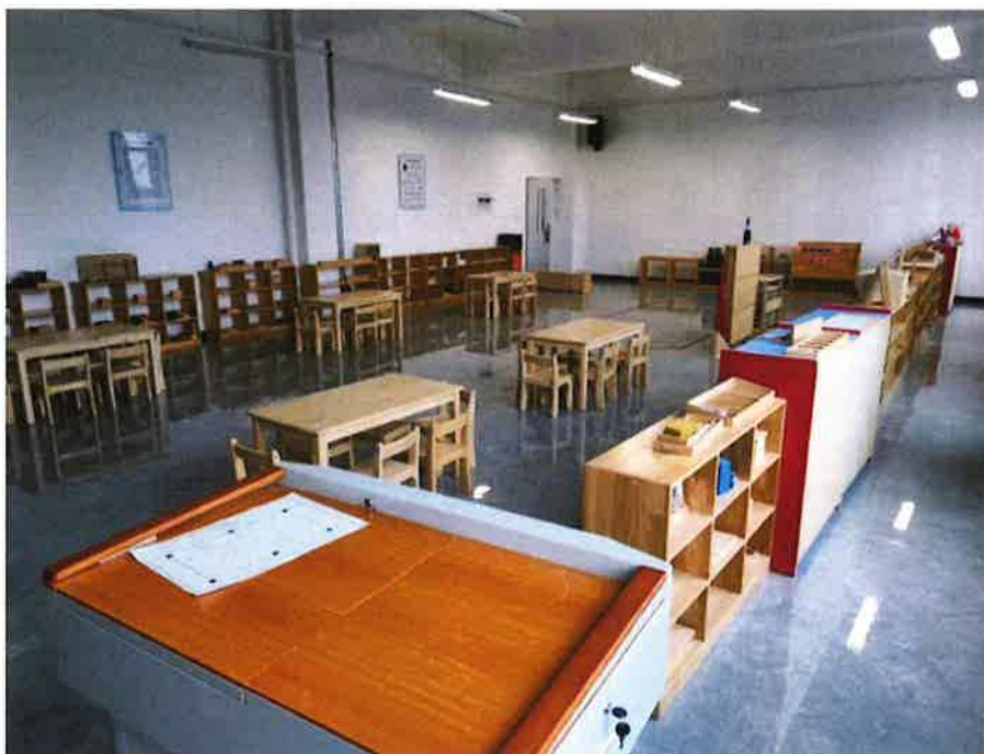
11.蒙台梭利教学实训室