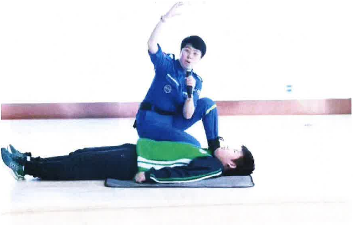
(蓝天救援队现场讲解急救知识)