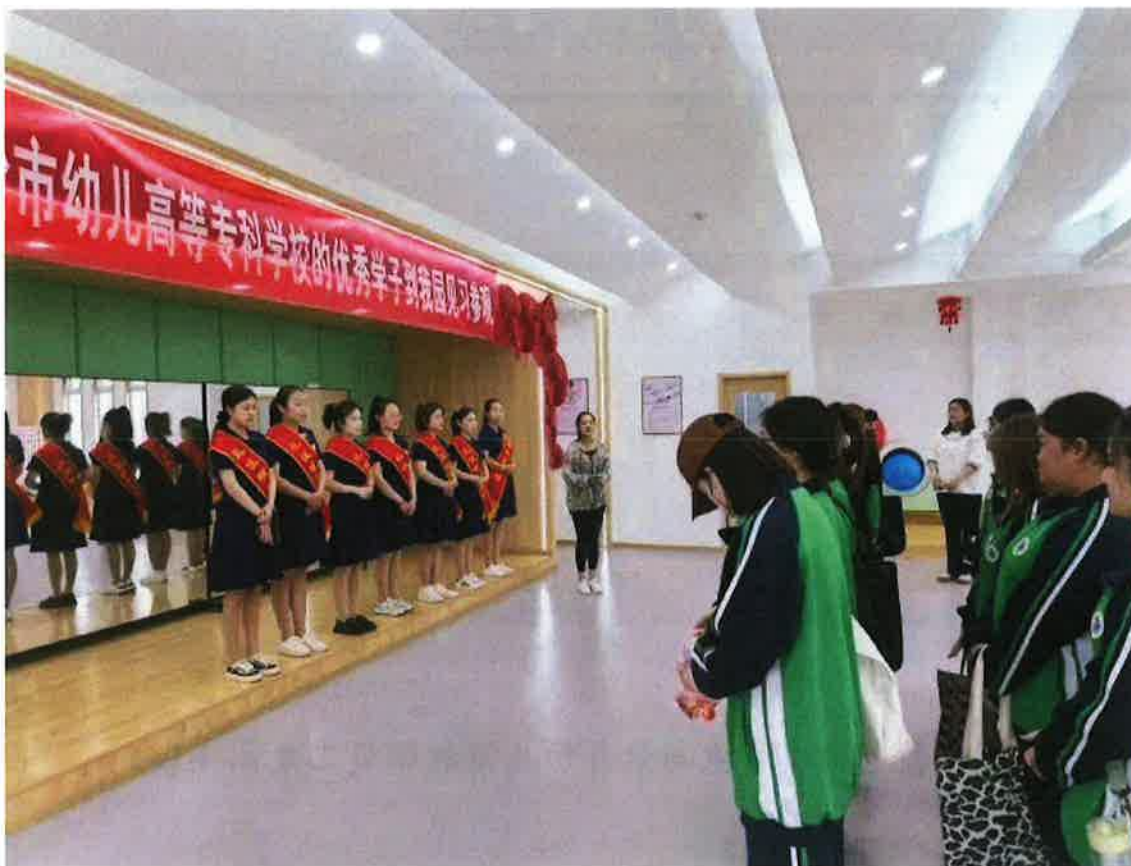
(学生们深入幼儿园跟岗锻炼)