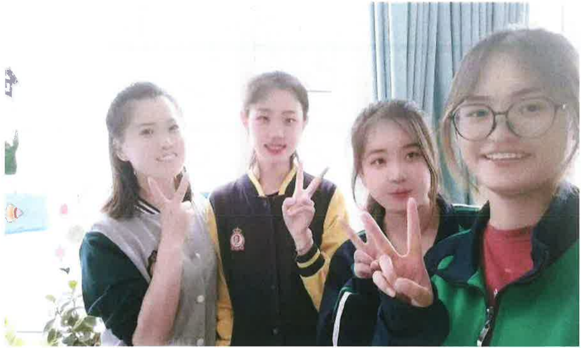
(学生与幼儿园、托育机构教师交流学习)