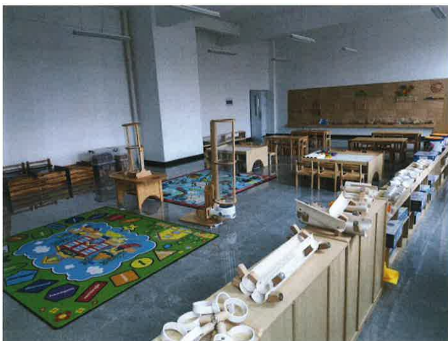
6. 幼儿科学活动实训室