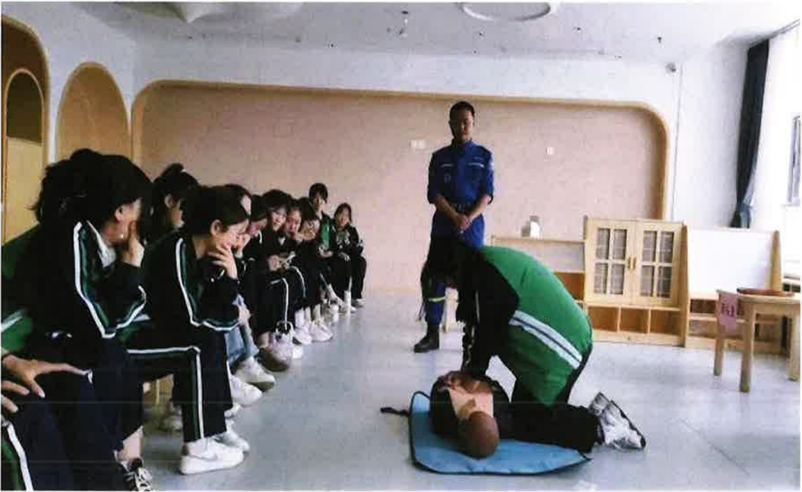
(同学们一一上手实操)