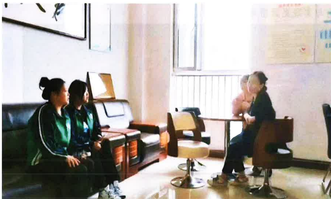
(学生与幼儿园长进行访谈)