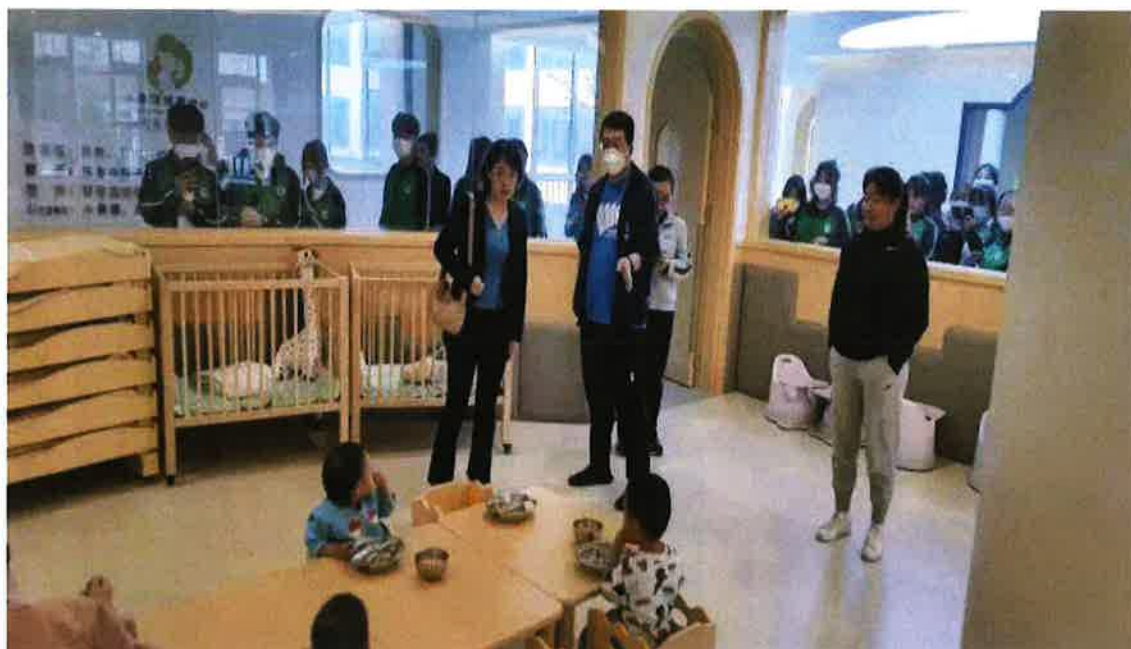
(每天安排 2 名专业教师跟班指导)