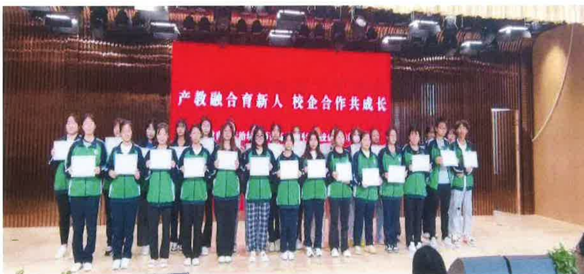
(经过 10 天认识实习活动，学生们获得认识实习结业证书)