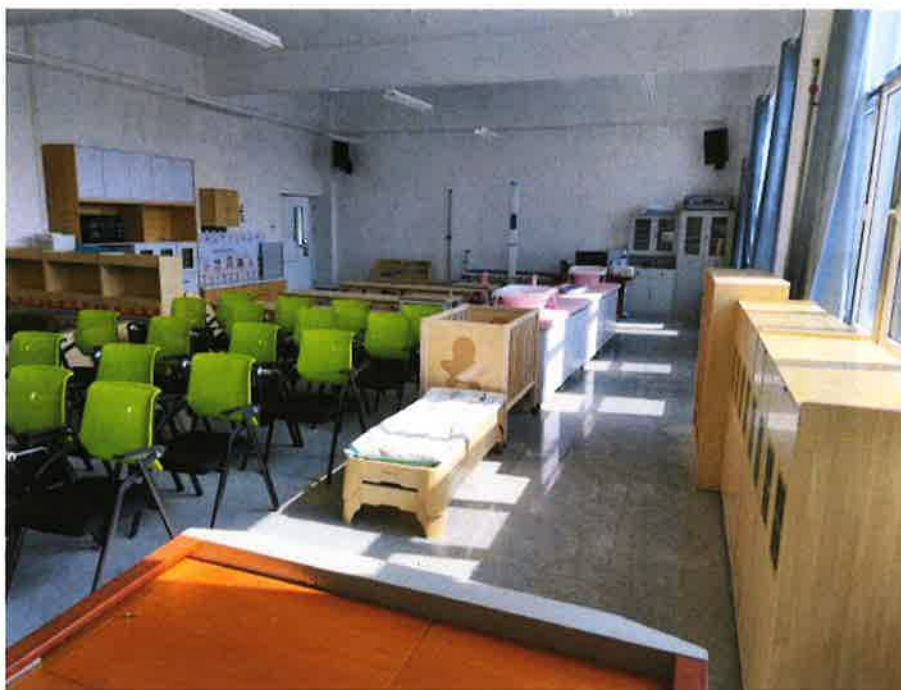
3. 幼儿医疗保健实训室