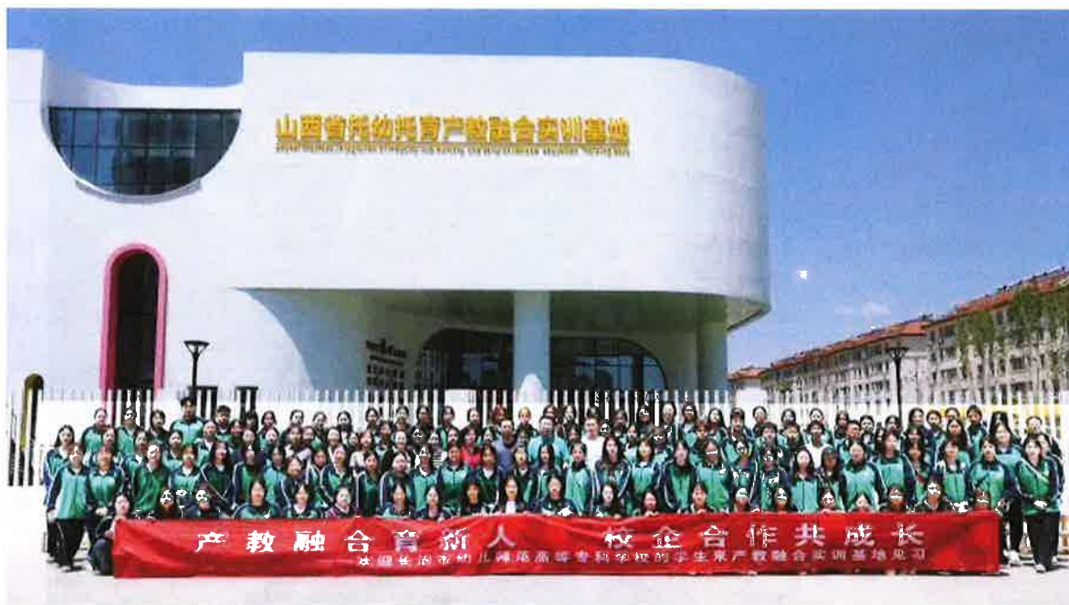
（我校带教老师、学生与紫丹幼儿园教职员工集体合影）

纸上得来终觉浅，绝知此事要躬行。此次认识实习活动，不仅使学生们认识到要成为一名合格的幼儿教师，需要将课堂中学到的理论知识和技能加以巩固提高并转化为实际应用能力，同时还使其进一步了解了幼儿园的日常教学和生活管理，为加强下一阶段的专业学习、巩固从事幼教事业的职业理想和信念打下了良好的基础。