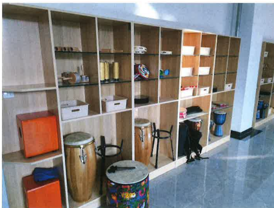
14.奥尔夫音乐实训室